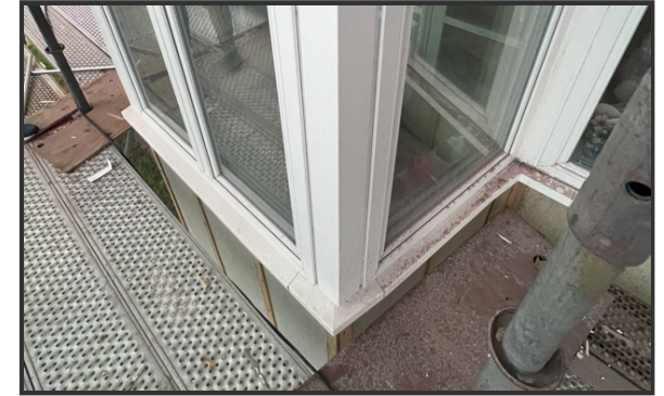
Hjørne - Foto fra byggepladsen