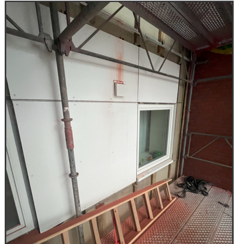
Facadeplade og hvid stormkappe